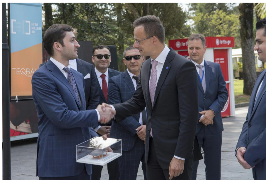
Szijjártó Péter külgazdasági és külügyminiszter átadja az asztalt Tornike Rihvadze, Adjara régió kormányfőjének.

Mindezt azért hoztam elő, mert 2019 nyarától a magyar külügy feje ezt a görbített ping-pong asztalt zseniális magyar találmányként trombitálja régi és új barátainak szerte Európában és Ázsiában. Szerinte azzal jobban meglepjük a világot, mint a golyóstollal, vagy a helikopterrel, vagy a kockánkkal. Legújabban az is kiderült, hogy még olimpiai számot is remélhetünk a híres magyar találmányi asztalunk felhasználásával. Ha ez sikerül, akkor nemzetünket talán még jobban becsülni fogják, és sok licenrdíj is fog dőlni a kasszánkba az új találmányunk után! Ezt követően beindult néhány zszurnalisztánk szövegszerkesztője, cifrázva e találmánysikerünket a szent foci szószával leöntve.